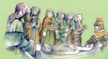
La mise au tombeau de Reygades

Camps et St Mathurin Léobazel étaient deux communes distinctes; elles se sont associées en 1972 et ont finalement fusionné en 2006 pour ne former plus qu'une seule et même commune.