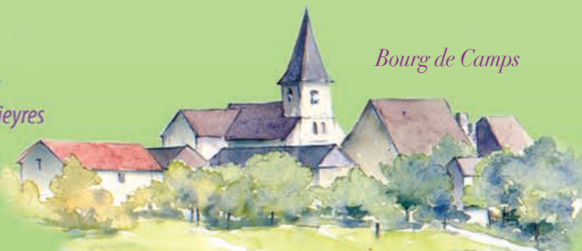
Bourq de Camps

Le Rocher du Peintre. Un magnifique panorama sur les gorges de la Cère vous convie à la peinture ... ou à la rêverie