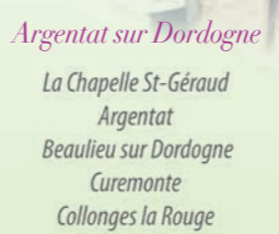
Argentat sur Dordogne La Chapelle St-Géraud Argentat Beaulieu sur Dordogne Curemonte Collonges la Rouge