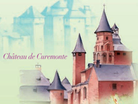
Château de Curemonte Collonges-la-Rouge