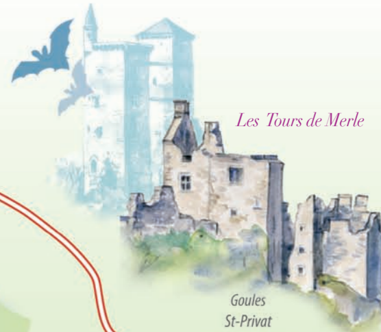
Les Tours de Merle